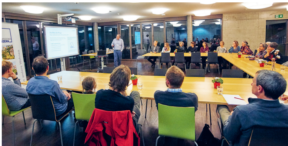
Genosschafterinnen und Genosschafter hören dem Referenten der ewl gespannt zu

https://www.ewl-luzern.ch/privatkunden/service/themenwelten/energie-sparen/